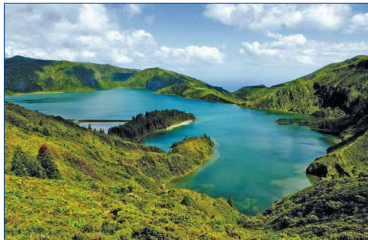
Azoren, Lagoa do Fogo