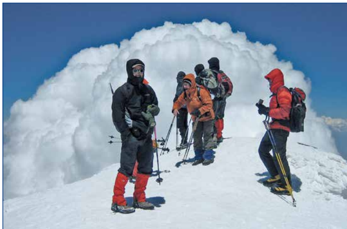
Am Gipfel des Ararat

12. - 21.7.2015 Flug ab München, Bus/Kleinbus, 5x ***Hotels und 4x Zelt/VP, Eintritte, RL € 1.340,--